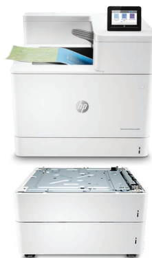
Bac 2 x 550 feuilles HP LaserJet avec socle (T3V29A)