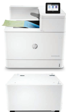
Socle HP LaserJet (T3V28A)