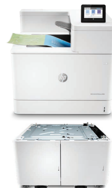
Bac d'alimentation haute capacité de 2 700 feuilles HP LaserJet avec socle (T3V30A)