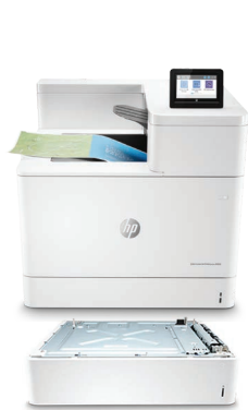
Bac d'alimentation de 550 feuilles HP LaserJet (T3V27A)

D'autres accessoires en option sont inclus dans les Informations relatives aux commandes en page 13.