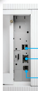
Gros plan du panneau d'E/S arrière