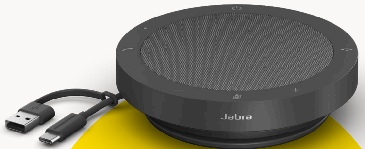
MODÈLES MS TEAMS ET UC

Pour apporter notre contribution à la protection de l'environnement, nous veillons à réduire notre empreinte écologique à chaque étape de la fabrication de nos produits. Le revêtement du Speak2 40 est composé de plus de 50 % de matériaux durables** et d'un nombre important de pièces réparables ou remplaçables. Voilà l'équation magique : préservation de l'environnement = durée de vie prolongée = qualité d'appels supérieure sur la durée, pour vous et votre équipe.