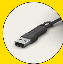
Connecteurs USB-C et USB-A fournis